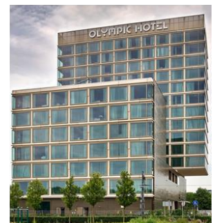
Olympic Hotel, Amsterdam