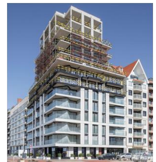
One Carlton, Knokke